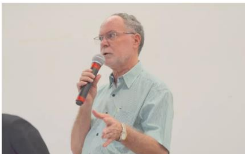
Prefeitura afirma que foi na gestão do atual prefeito, Barjas Negri, que o Diário Oficial passou a ser disponibilizado de forma online